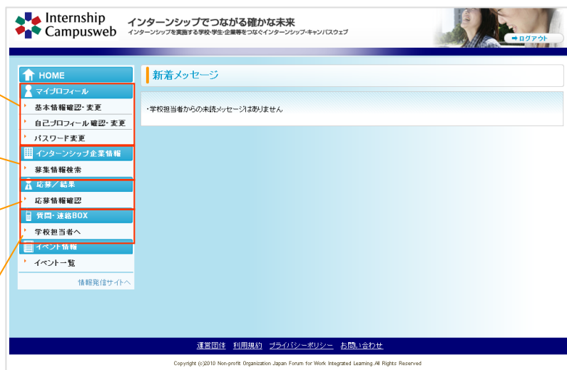
学生システム(ログイン後の画面)